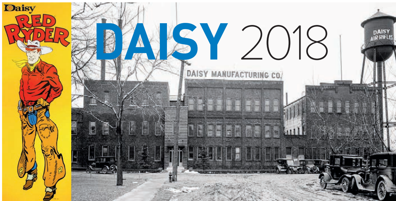
■ Areál firmy Daisy odhadem ve druhém desetiletí 20. století

Spojené státy jsou země, kde se ve velkém vyráběly vzduchovky. Píšeme o tom v čase minulém, protože si myslíme, že výroba přinejmenším těch levných se už dávno přestěhovala do levných zemí. Ovšem tradice amerických vzduchovkářů tady nepochybně je a dá se s ní pracovat.