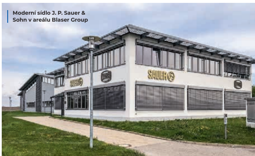
Moderní sídlo J. P. Sauer & Sohn v areálu Blaser Group

Abychom se s novou verzí této prestižní samonabíjecí kulovnice předního německého výrobce včas a důkladně seznámili, pozvala nás zbrojovka jako svého výhradního partnera pro český trh do svého školicího centra. V osobní pozvánce pak kromě obvyklého programu stálo něco jako: „Přijed' se podívat na nejmodernější a nejluxusnější samonabíjecí kulovnici na trhu a pojdme se jí pokusit společnými silami utavit.“ Uznejte, že takové výzvě se nedalo odolat, a čas ani vzdálenost do Isny im Allgäu, malebného městečka na pomezí Bádenska-