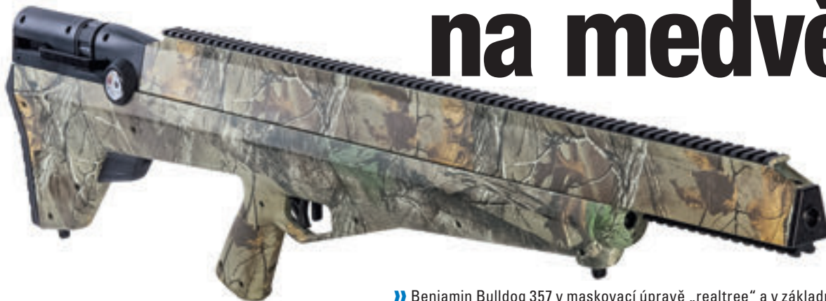
» Benjamin Bulldog 357 v maskovací úpravě „realtree“ a v základním černém provedení