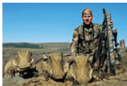
» Tři prasata bradavičnatá střelená Bulldogem na víc než 50 yardů

V Americe se Bulldog považuje za vhodný nejen k lovu menších predátorů, ale i velkých divokých prasat, trofejové jelení zvěře a v neposlední řadě medvědů. Jim Shockey, profesionální lovec částečně ve službách Crosman Corp. (a hvězda televizních loveckých pořadů), je prý Bulldogem nadšen. Jiný profesionální lovec Ian Harford na základě vlastních zkušeností tvrdí, že tato zbraň se dobře hodí také k odlovu většiny druhů zvěře žijících na afrických pláních, a to až asi ze vzdálenosti 70 yardů. Zpravidla mu stačila jediná rána.