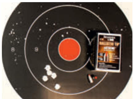
» Benjamin Bulldog 357: 5 ran na 50 yardů

rost! V USA ostatně existuje asociace lovců se vzduchovkami, která vede i lovecké „světové rekordy“ dosažené s tímto typem zbraně.