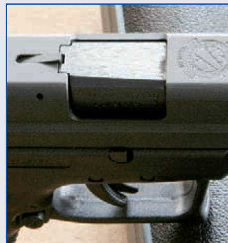
Výstražník vystupující nad horní plochu závěru informuje o přítomnosti náboje v nábojové komoře

Hranolová mířidla zvýrazněná třemi bílými body jsou nasunuta v příčných