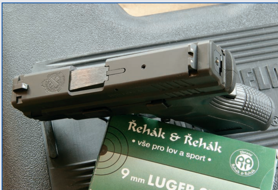
Ze zadního čela vystupuje tyčinka, která signalizuje napnutí bicího mechanismu

Rozebírání k čištění je snadné. Vyjmeme zásobník a zkontrolujeme, ne-