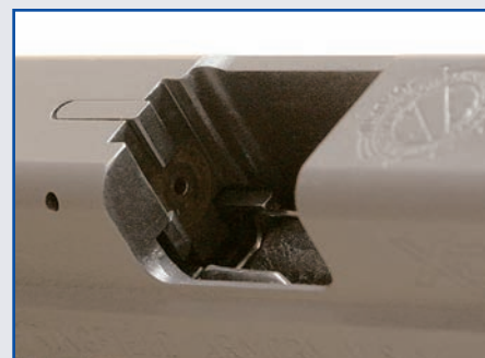
Ve výhozním okénku otevřeného závěru je částečně viditelný vytahovač

drážkách na rovném hřbetu závěru. Tvoří je výrazná muška a hledí s pravouhlejším zářezem. Dvouřadý zásobník s jednořadým vyústěním pojme 10 ná-