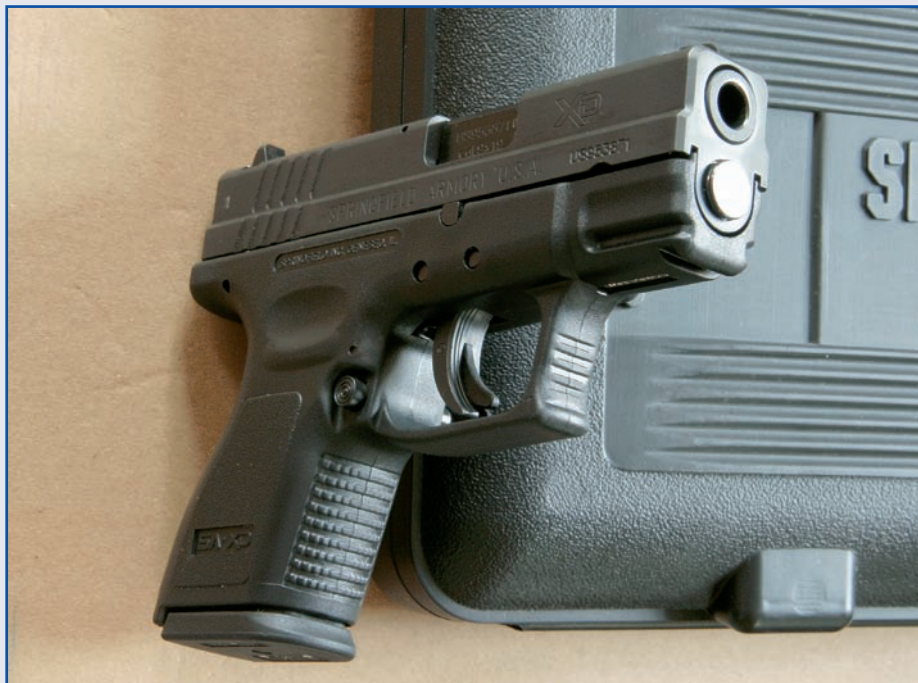
Čelo vodítka vratné pružiny vystupuje před čelo závěru a brání nežádoucímu pohybu závěru při tlaku na zbraň, úderu nebo pádu

řovou pojistku, vyhazovač, záchyt úderníku a ovládání odpružené úderníkové pojistky. Ocelový závěr je uzamčen moderní podobou systému Browning, kvadratickým pláštěm hlavně do výhozního okénka. Hlaveň má okolo ústí rozšířený prstenec, který vystřeďuje její polohu v čele závěru. Dvojice vratných pružin je nasazena na teleskopickém vodítku.