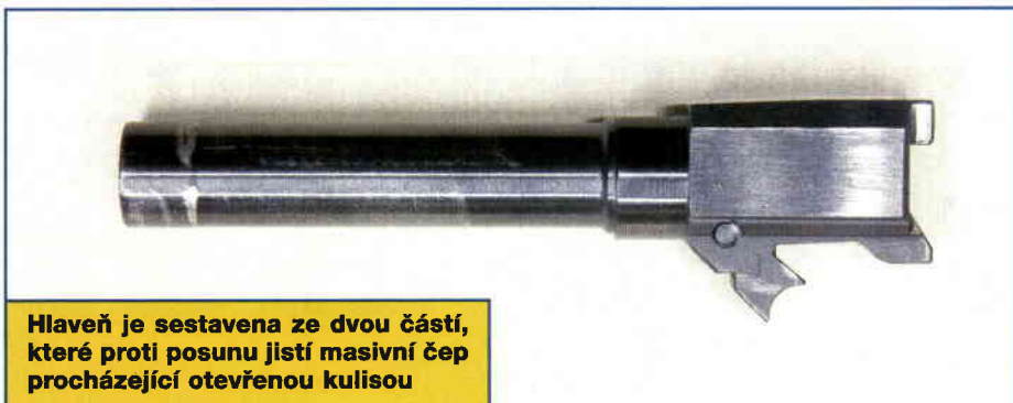
Hlaveň je sestavena ze dvou částí, které proti posunu jistí masivní čep procházející otevřenou kulisou

Spoušťový mechanismus pracuje ve standardním jednočinném režimu SA (po natažení závěru a zasunutí náboje do nábojové komory je plně napnuta pružina úderníku). Bezpečnost zbraně dále zvyšuje spoušťová pojistka bránící nechtěnému stisknutí spouště a dlaňová pojistka v horní části hřbetu rukojeti, která dokud není stisknuta brání pohybu záchyty úderníku, a tím i spouště a zároveň blokuje pohyb závěru. Prvky pasivní bezpečnosti doplňuje mohutná hlava vodítka vratné pružiny přesahující čelo závěru. Plní funkci nárazníku při pádu zbraně na čelo závěru, brání pohybu závěru při pádu zbraně na ústí nebo při zatlačení na čelo závěru a umožňuje výstřel na kontaktní vzdálenost nebo při náhodném opření zbraně o překážku. Kromě spouště tvoří ovládací prvky oboustranný záchyt zásobníku a levostranný zá-