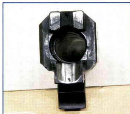
Ústí nábojové komory se skluzavkou navádějící náboj do komory a rozdvojeným výstupkem, do jehož drážky se zasunuje výstražník

Během střelecké zkoušky provedené na patnáctimetrovém střílništi střelnice AVIM v Praze na Florenci mě pistole okamžitě přesvědčila o svých přednostech. Již první výstřely vstoje s oboustranným držením a bez opory překvapily