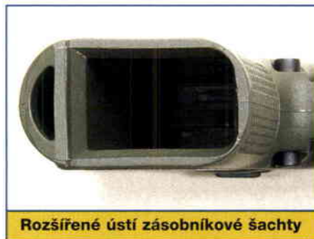
Rozšířené ústí zásobníkové šachty

Závěr je odpružen dvojicí vratných pružin nasazených na dvojitým teleskopickém vodítku. V zadní části závěru je odpružený přímoběžný úderník, jehož nežádoucím pohybem brání automatická bloková pojistka. Vedle