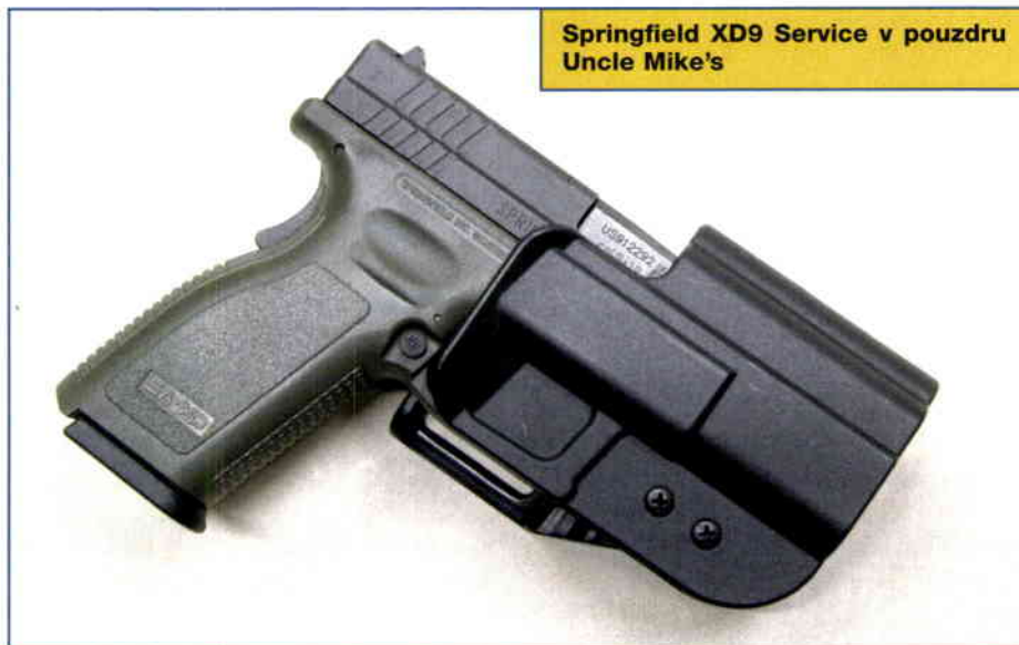
Springfield XD9 Service v pouzdru Uncle Mike's

Od roku 2006 pražská firma Proarms, které děkujeme za možnost vyzkoušet zbraň (a za poskytnutí nábojů CCI), dodává Springfieldy XD9 Service v plastovém kufříku se třemi zásobníky, kvalitním opaskovým kydexovým pouzdem a pouzdem na dva náhradní zásobníky (vyrobenými firmou Uncle Mike's) a s návodem k použití za 18 900 Kč.