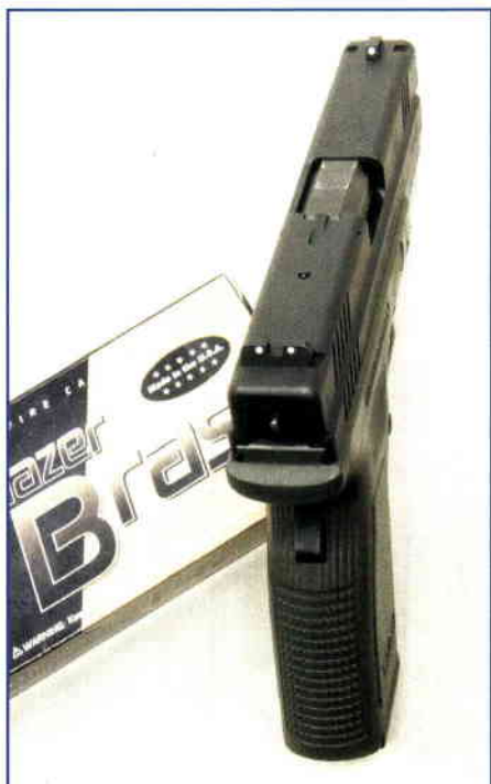
Ze zadního čela vystupuje tyčinka, která signalizuje natažení bicího mechanismu; vystupující výstražník na hřbetu závěru upozorňuje na přítomnost náboje v nábojové komoře

úderníku je vsazen vytahovač s pružným tělem, které nevyžaduje další pružinu. V zadní části výhozního okénka je odpružený výstražník upozorňující na přítomnost náboje v nábojové komoře a v zadním čele závěru je otvor, z něhož po napnutí úderníku vystupuje tyčinka informující o napnutí bicího mechanismu. Tělo závěru má zdrsnění šesti řadami úchopových drážek. Na jeho hřbetu jsou v příčných drážkách nasunuta mířidla tvořená hranolovou muškou a hledím s pravouhlym zářezem; zaměřovací prvky jsou zvýrazněny bílými tečkami.