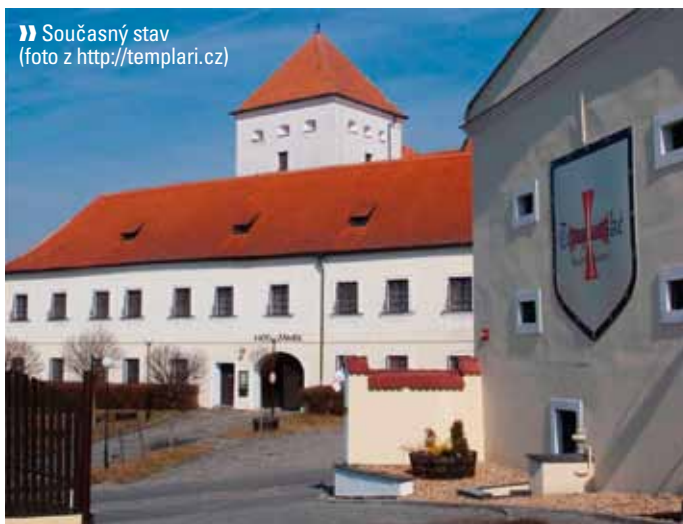
Současný stav

stva Templářské sklepy Čejkovice, využívajícího velkou část místního podzemí. Ve starobylých prostorách zámečku je provozován hotel.