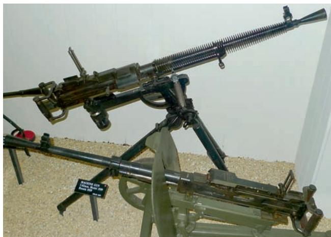
Sovětské 7,62mm těžké kulometry vz. 39 a vz. 43

deen Proving Group, Building 2601, Aberdeen, Maryland a je otevřeno denně od 9 do 16.45 h. Jelikož se jedná o vojenskou základnu, nelze se divit přísnějším procedurám při vstupu. Armáda však nevybírá vstupné a fotografování je povoleno.