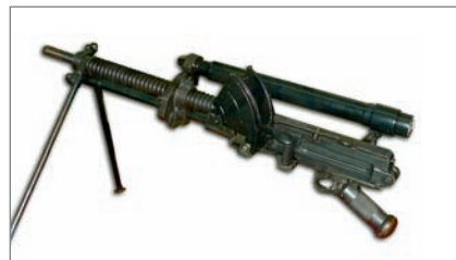
◀ Japonský tankový kulomet vzor 91 (1931) ráže 6,5 mm