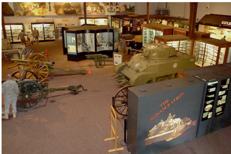
◀ V expozici je nepřehlédnutelný lehký tank M5A1

ku pak českému návštěvníkovi může připomenout puška Winchester model 1895 objednaná carskou vládou v ráži 7,62x54R v době první světové války.