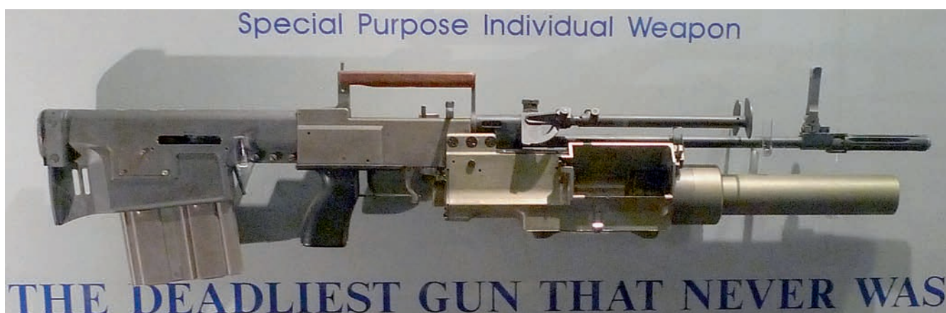
Prototyp útočné pušky projektu SPIW ze 60. let