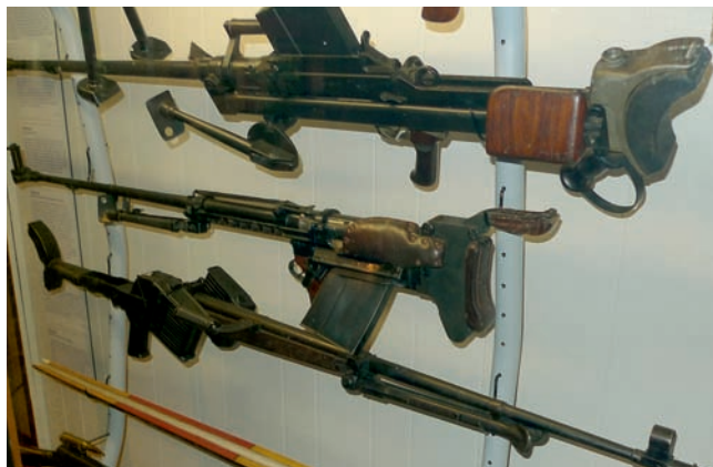
Československé zbraně reprezentuje protitanková puška vz. 41 ráže 7,92 mm ze Zbrojovky Brno. Dole je německá protitanková Panzerabwehrbüchse 39 ráže 7,92 mm a nahoře britská protitanková puška Boys.