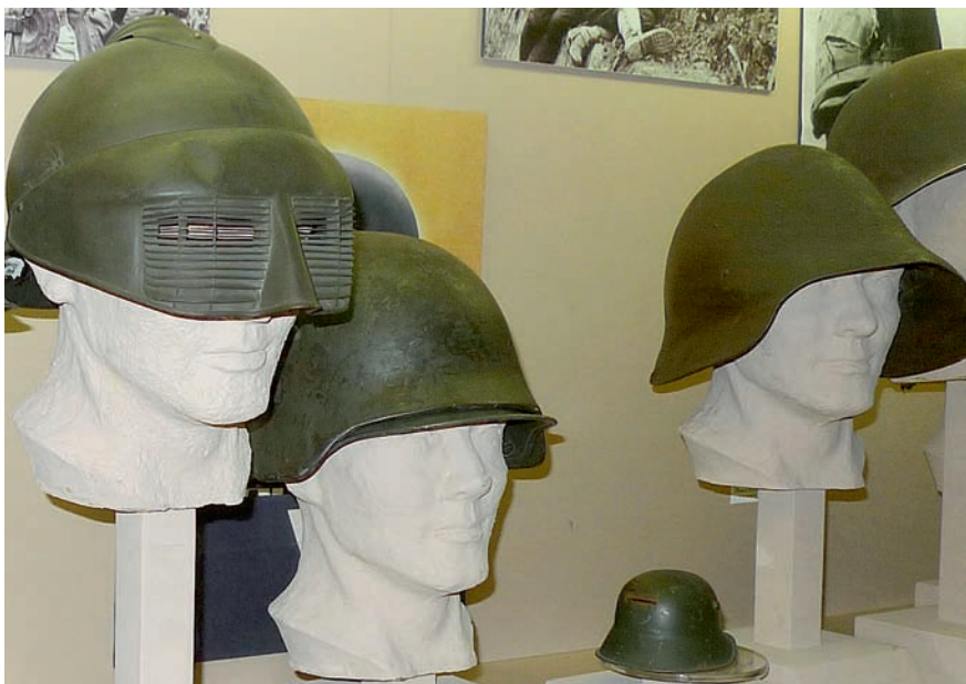
Francouzská experimentální přilba z roku 1916, německá helma vz. 1916 a její model, americká pokusná přilba z roku 1917

V expozici samonabíjecích pušek pak lze spatřit unikáty z meziválečného období jako prototypy samonabíjecí pušky Thompson model 1923 a prototypy nebo sériově vyráběné zbraně dalších amerických konstruktérů Pedersena, Garanda a Johsona, ale i italské firmy Breda a Scotti model X. Z československých výrobků je zde vystavena i Holková puška ZH 29. Sovětskou konstrukční školu přibližuje samonabíjecí puška Sergeje Simonova AVS-1936 nebo Fedora Tokareva