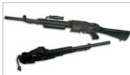
◀ Pěchotní a tankový kulomet Stoner 63 ráže 5,56x45 mm z roku 1960

1891 a portugalská puška systému Kropatschek ráže 11 mm. Velmi zajímavá je i jedna z posledních sériově vyráběných opakovacích pušek, či spíš karabin, Madsen M47 model 1958 ráže 30 pro ozbrojené síly Kolumbie. Výzbroj čs. legií v Rus-