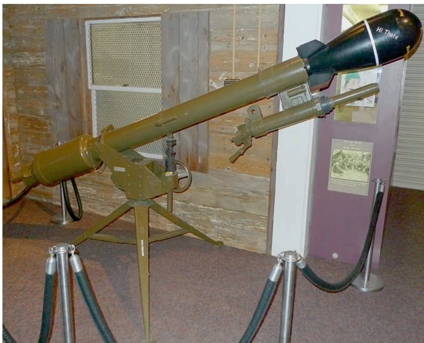
Taktický nukleární bezzákluzový kanon David Crockett

Z velkorážních kulometů je kromě několika verzí známého amerického kulometu M2 vystaven francouzský 13,2mm kulomet Hotchkiss vz. 1930, používaný