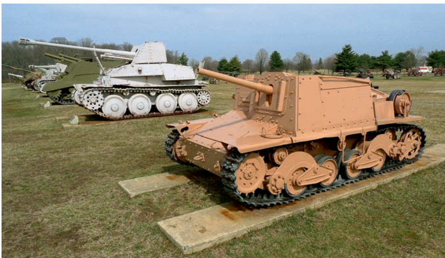
◀ Drobná ukázka z výstavní plochy obrněné techniky: italské samohybné dělo 47/32 (Semovente da 47/32), v pozadí německý Marder III (Sd.Kfz.139) na podvozku čs. lehkého tanku LT-38 vyzbrojený sovětským 76,2mm kanonem typu F-22 v německých službách označeným 7,62cm PaK 36(r)

Několik vitrín je věnováno nestarším americkým dlouhým palným zbraním, především však z 19. století. Nechyběly pušky z americké občanské války, ale ze zbraní, které dobyly západ, je vystavena snad jen Henryovka model 1860, a to kvůli konstrukci závěru. Ze stejného důvodu je vystavena i jehlovka Dreyse vz. 1862 a francouzská revolverová puška systému Lefauchaux. Na české poměry unikátní jsou například zde vystavené švýcarské pušky Vetterli model 1881 nebo Schmidt-Rubin model 1919, norská puška Krag-Jørgensen