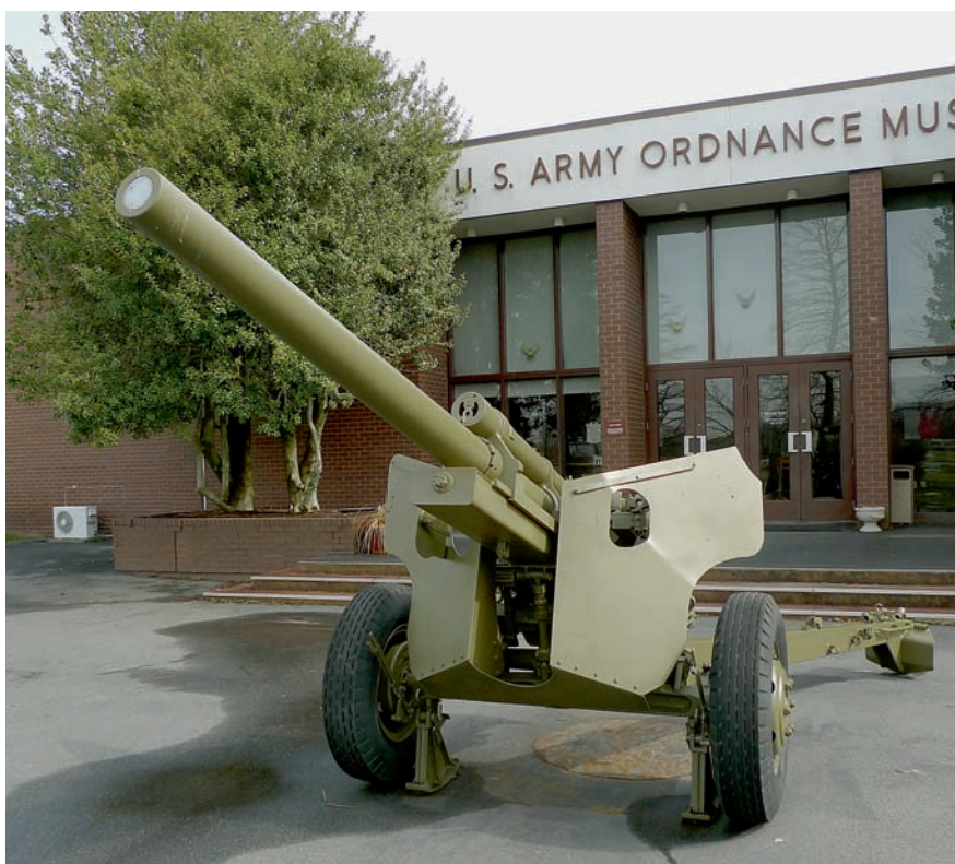
Vchod do muzea s americkým protitankovým kanonem M5 ráže 76,2 mm z druhé světové války

SVT-40 a německou pak pokusná puška Walther a standardní Walther G-43. Za unikát můžeme považovat i japonskou samonabíjecí pušku vzor 5 zavedenou do výzbroje v dubnu 1945, jejíž konstrukce byla silně ovlivněna americkou puškou M1 Garand. Poválečné období reprezentují například egyptská puška Hakim a americký prototyp T44E9, což je budoucí útočná puška M 14.