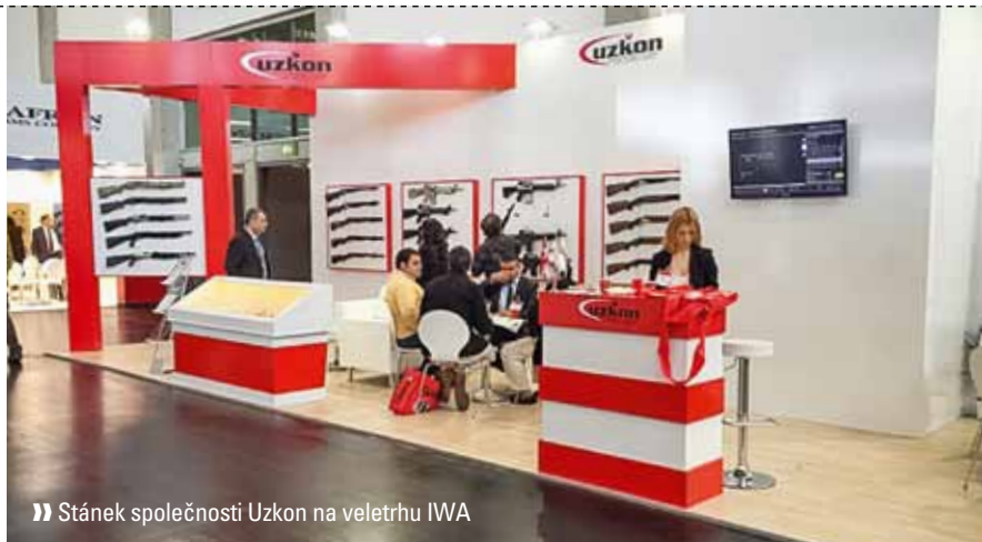
» Stánek společnosti Uzkon na veletrhu IWA

Někdo se stále ještě domnívá, že Turecko je na světovém trhu s ručními palnými zbraněmi bezvýznamný hráč. Při procházení hal norimberského veletrhu však mohl návštěvník nabyt poněkud jiného dojmu. Tureckých firem zde bylo přítomno nepočítaně, ostatně stejně jako v posledních letech pokaždé. Co se týká brokovnic, tak počtem výstavních stánků snad dokonce měli turečtí vystavovatelé převahu nad ostatními tradičními zeměmi.